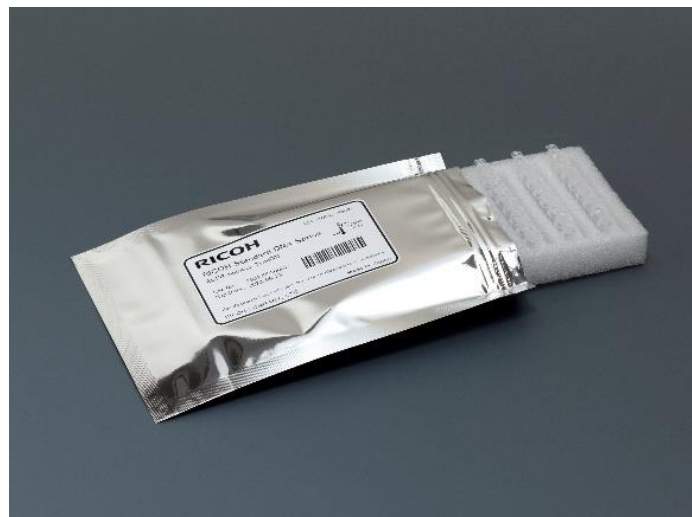
製品写真:RICOH Standard DNA Series EGFR mutation Type001